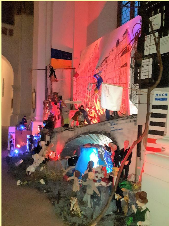
Krippe am Fluss Jesuitenkirche